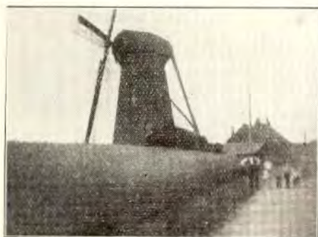
4. BERGMOLEN TE KELPEN-NEDERWEERT