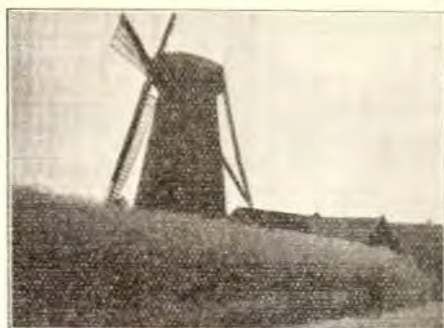
3. BERGMOLEN TE WEERT-ROEVEN