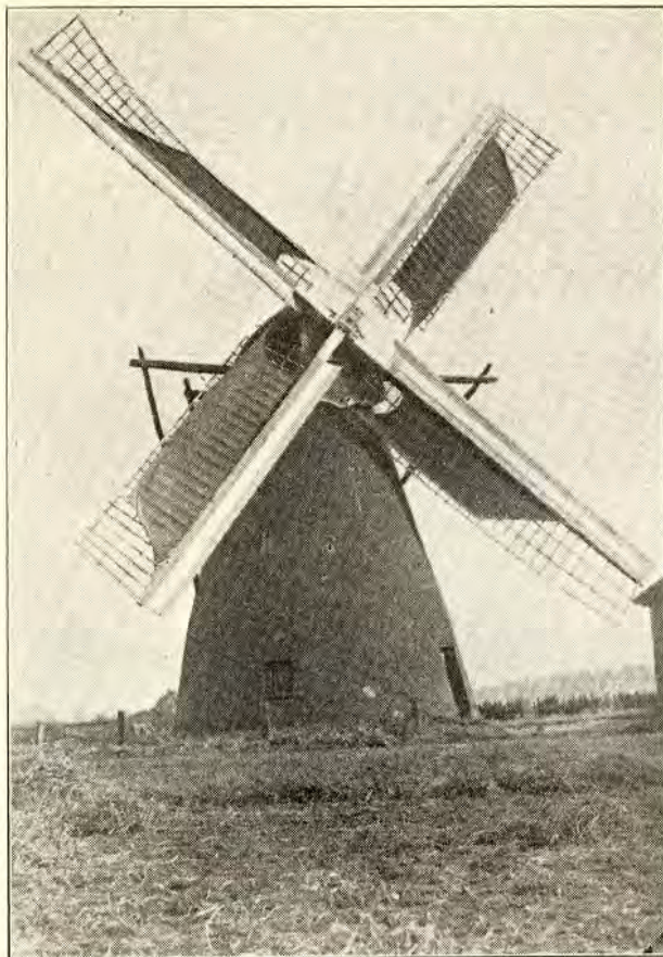
8. STEENEN GRONDMOLEN TE WESSEM