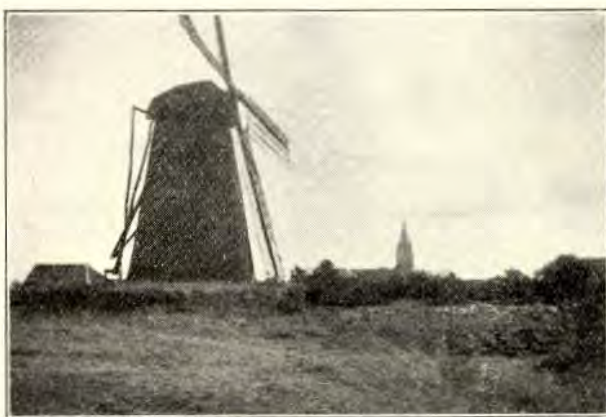
7. STEENEN BERGMOLEN TE THORN

Afbeelding 7. Steenen bergmolen te Thorn, gezien van uit het Westen. Rechts op den achtergrond de kerktoeren van Thorn. Op den voorgrond der foto rijpende halmgewassen, die door zware bemesting tegen de vlakke zijn gegaan, zoodat ik er door wandelen kon zonder de veldvruchten te beschadigen. De molen van Thorn werd gebouwd in 1865; vijf en twintig jaren daar-