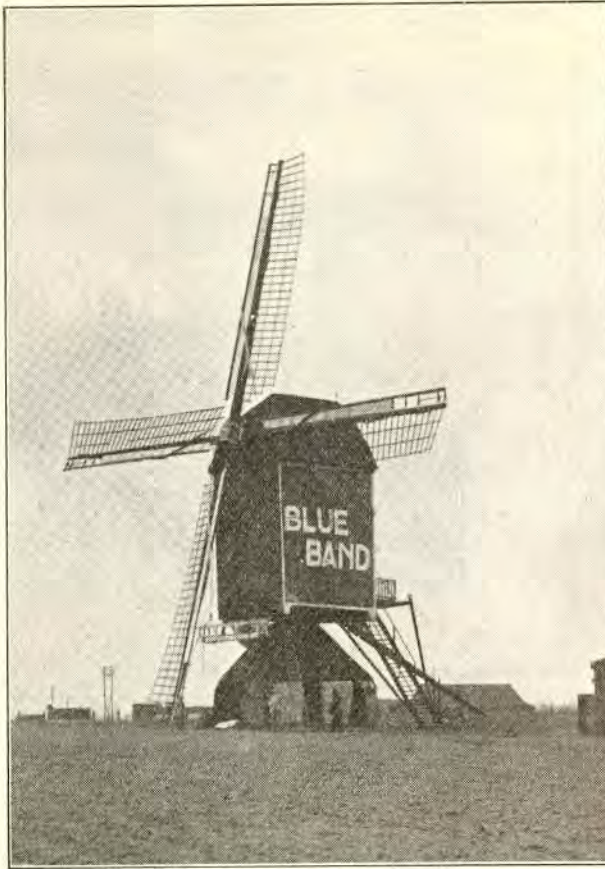
10. STANDAARDMOLEN TE BAEXEM

verwoest. We gaven een afbeelding van dien molen in het Maart - nummer 1930 van dit tijdschrift op blz. 95, bij afbeelding 12. U vraagt me : wat is nu een stróómlijn ! Ja, 't zit m enkel in de wicken... Vóór de wicken, of juist : de balken, de roeden, is over de geheele lengte van plaatwerk een gleufvormige holte gemaakt, met openingen aan beide einden van elke wiek: de stroomlijn, waardoor de wind zoo bijzonder vat op de wicken heeft. Vóór het latwerk wordt, zoo noodig, het gewone zeil gespannen. Men zal zich afvragen : hoe wordt dit systeem toegepast bij zeer fellen wind, wanneer reeds bij betrekkelijke windstilte flink kan worden gemalen ? Me dunkt, met heel weinig moeite en kosten zal de stroomlijn kunnen worden uitgeschakeld.