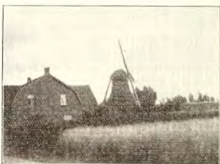
6. STEENEN BERGMOLEN TE HUNSEL