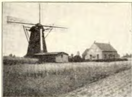
2. BERGMOLEN TE LEVEROY