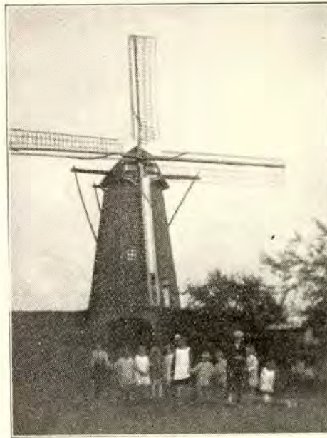
9. STEENEN BERGMOLEN TE OLER-GRATHEM

Dat wenschen we eerstens voor de molenaars en tweedens voor het landschap der Nederlanden!